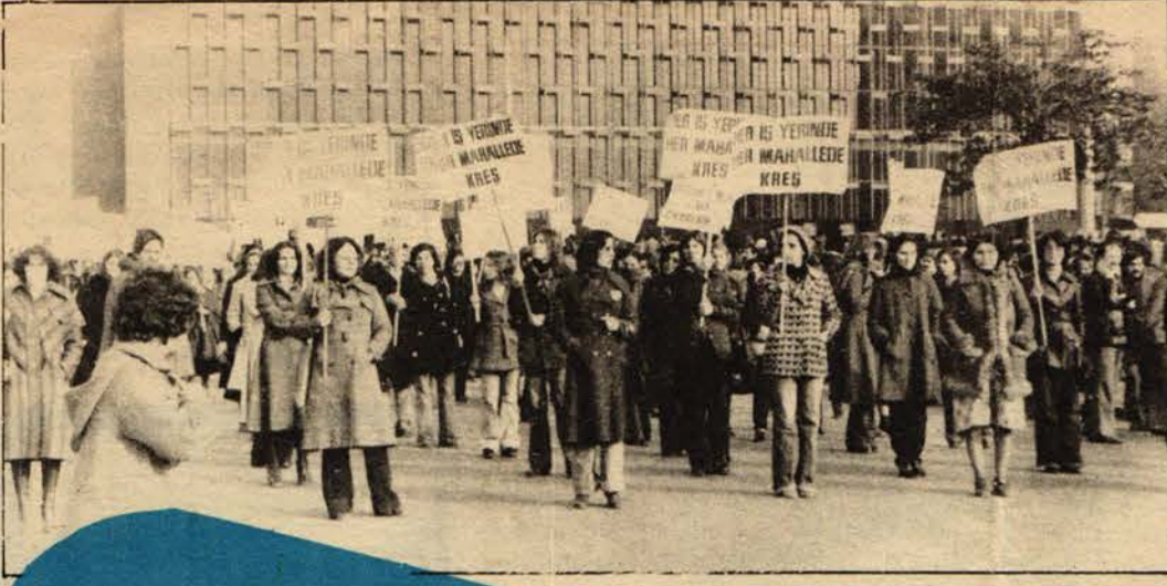
Kadın öğretmenler «Dünya Kadınlar Günü»nde