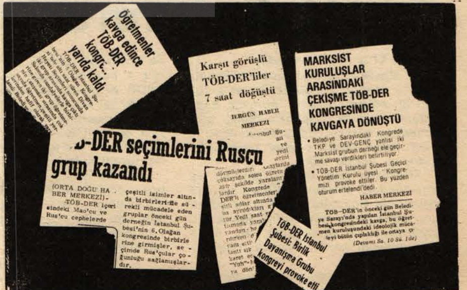
Gerici basından haber başlıkları.

Her şeyden önce öğretmenlerin yığınsal birliği yenilmez boyutlara ulaşmıştır. Öğretmenler işçi sınıfının savaş yolundaki bu yığınsal birlik ve dayanışmadan aldıkları güçle, yaratılan bunalımı çözecek, gerici faşist güçlerin karşısına daha büyük bir güçle çıkacaklardır.