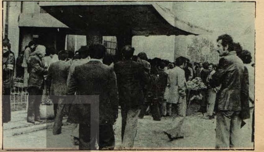
Öğretmenler içeri girmek için kongre binasının önünde bekliyor

● Şubemize, öğretmen tabanına düşman bir yönetim atadığımızda, İstanbul öğretmenleri «Bu kişiler şubeyi kongreye götüremez, bu kişilerle gidilecek bir kongrede öğretmenin güvenliği yoktur» diyordu. Buna karşılık Gazioğlu yaptığı basın toplantısında «Her türlü güvenlik Genel Merkezimiz tarafından alınacak, son derece güvenilir ve demokratik bir kongre olacak» şeklinde kamuoyuna açıklamalarda bulunuyordu. Genel Başkan ve Genel Merkez olarak aldığımız önlemleri açıklayınız. Yoksa bu saldırıyı siz mi tezgâhladınız?