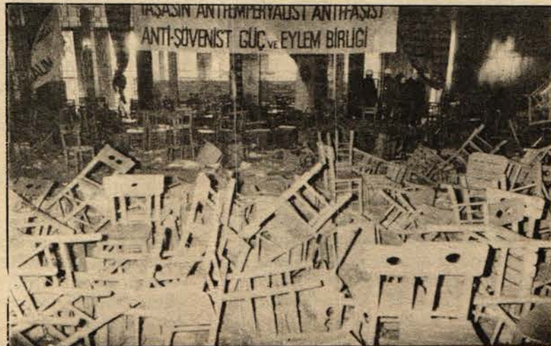
13 Mayıs kongresi dağıtıldıktan sonra salonun hali.

● Bütün bunların hesabı sorulmayacak mı zannediyorsunuz?