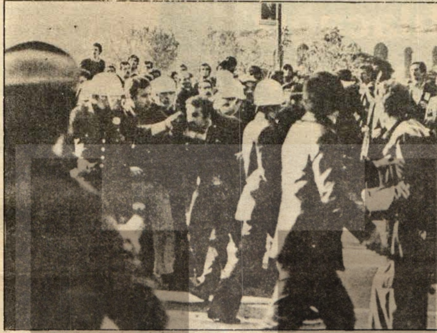
Belediye Sarayı önünde polis saldırısı

TÖB - DER'li öğretmenler 13 Mayıs tarihsel dönemeç gününde, sabahın erken saatlerinde itibaren kongreye akmaya başladılar.