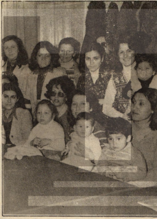
Kadın öğretmenler bir toplantıda. Kadın öğretmenler hakları için yürüyorlar.